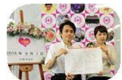
記念写真コーナー

時折、市役所前で婚姻届を手に写真を撮っておられるカップルをお見かけしますし、実は私もその昔に写真を撮ったクチ。これは面白いと9月議会で提案したところ検討するとのことでした。